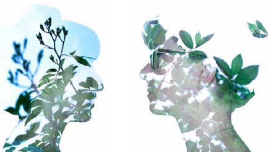
Bénédicte Lassalle, Autoportrait , 2012