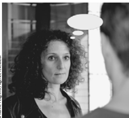
Karine Pelgrims, Fotomanzo, 2012