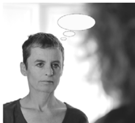
Karine Pelgrims, Fotomanzo, 2012

Comme c'est le cas dans plusieurs propositions, c'est également le végétal, ici la terre et la forêt, qui semble constituer le lien du travail commun de Yann Amstutz & Gilles Picarel . Un dialogue d'images, où la représentation de soi et de l'autre se trouve malmenée et déconstruite, entraînée par des jeux de rôle et de boîtiers interchangeables. Il en résulte une série de portraits à l'identité volontairement brouillée, impliqués dans un mouvement de coalescence qui travaille à la création d'un «je» hybride.